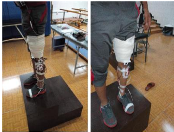
شکل ۲. نحوه الکتروگذارای عضلات

قوزک داخلی و گاستروکنمیوس داخلی بر روی بالک اصلی عضله در جانب داخل قرار گرفت (۱۲) (شکل ۲).