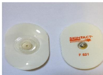
شکل ۱. الکترودهای بیضی‌شکل SKINTACT

از شاخص استاهلی ۱ استفاده شد (۳۰). بدین صورت که ابتدا پودر تالک بر روی صفحه‌ای که از قبل تهیه شده بود، به مقدار کافی پاشیده شده و از فرد خواسته می‌شد تا حد ممکن به صورت عادی از چند متر عقب‌تر شروع به راه رفتن کند و به‌طور عادی و بدون توجه به صفحه پای خویش را بر روی آن قرار دهد و از آن گذر کند. سپس کم‌عرض‌ترین نقطه کف پا و عریض‌ترین نقطه پاشنه هر پا در نقش ثبت شده در صفحه مشخص می‌شد و از تقسیم کم‌عرض‌ترین نقطه کف پا بر عریض‌ترین نقطه پاشنه شاخص استاهلی برای هر فرد محاسبه می‌شد. دامنه طبیعی شاخص استاهلی بین ۰/۴۴ تا ۰/۸۹ است و اعداد بالاتر از ۰/۸۹ به‌عنوان کف پای صاف محسوب می‌شوند (۳۰). برای بررسی فعالیت الکتریکی عضلات از دستگاه الکترومیوگرافی سطحی مدل ME6000 ساخت شرکت Mega فنلاند استفاده شد. این دستگاه دارای ۱۶ کانال است که در تحقیق حاضر از ۴ کانال برای بررسی عضلات و ۱ کانال برای استفاده از سوئیچ کف‌پایی ۲ استفاده شد. در این تحقیق از الکترودهای سطحی یک‌بار مصرف F-521 بیضی‌شکل، مارک SKINTACT ساخت اتریش استفاده شد (شکل ۱).