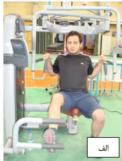
شکل ۳_ الف) اندازه‌گیری قدرت عضلات پروتراکتور