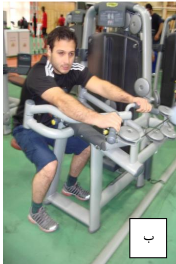
ب) اندازه‌گیری قدرت عضلات ریتراکتور