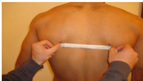
شکل ۲ - چگونگی اندازه‌گیری فاصله بین استخوان‌های کتف با متر نواری

برای اندازه‌گیری فاصله استخوان‌های کتف تا ستون فقرات در وضعیت آناتومیکی از متر نواری استفاده شد. برای انجام این تست ابتدا آزمودنی پشت به آزمون‌گیرنده به‌طوری‌که دست‌هایش در کنار بدن (حالت خنثی) قرار داشتند، می‌ایستاد. در این حالت ابتدا لبه داخلی زاویه تحتانی کتف مشخص و با مایژیک علامت‌گذاری می‌شد. همبستگی علامت‌گذاری لبه داخلی زاویه تحتانی کتف از روی پوست در مقایسه با ارزیابی رادیوگرافی همان نقطه، در حد ۰/۹۱ ذکر شده است (۵). سپس آزمون‌گیرنده زائده خاری نزدیک‌ترین مهره را پیدا کرده و آن را علامت‌گذاری می‌کرد. در مرحله بعد سر متر نواری را روی علامت زائده خاری قرار می‌داد و فاصله آن تا زاویه تحتانی کتف را اندازه‌گیری می‌کرد. بدین صورت فاصله دو استخوان کتف از یکدیگر محاسبه شد (شکل ۲).