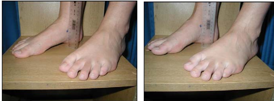
شکل ۱_ اندازه گیری افت ناوی برگرفته از مطالعه شوئلنوس و همکاران (۲۰۰۱)

اندازه گیری افت استخوان ناوی : برای اندازه گیری پرونیشن پا از آزمون برودی ۱ استفاده شد. برای اندازه گیری افت ناوی، ابتدا از آزمودنی خواسته شد روی صندلی بنشیند، درحالی که ران و زانوی او در وضعیت فلکشن ۹۰ درجه، کف پاهای او روی زمین و مفصل ساب تالار او در وضعیت خنثی و در وضعیت بدون تحمل وزن ۲ قرار داشت. آزمونگر برجستگی استخوان ناوی آزمودنی را لمس و مشخص می کرد و فاصله آن را تا زمین با خط کش اندازه می گرفت. سپس از آزمودنی خواسته شد در وضعیت ایستاده قرار گیرد و پاها را به اندازه عرض شانه باز کند و وزن بدن را به طور مساوی روی دو پا در وضعیت تحمل وزن ۳ قرار دهد. فاصله استخوان ناوی تا زمین دوباره اندازه گیری شد (شکل ۱). اختلاف بین این دو وضعیت به میلیمتر به عنوان مقدار افت ناوی ثبت شد. اندازه گیری در پای چپ و راست آزمودنی ها ۳ بار تکرار و میانگین آن به عنوان افت ناوی ثبت شد (۵).